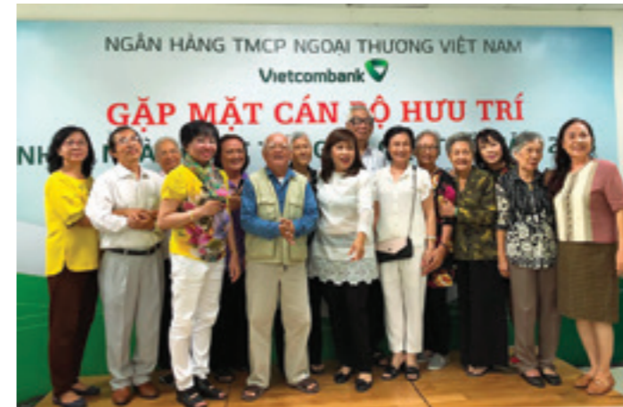
Các cán bộ hưu trí chụp ảnh kỷ niệm tại TP. Hồ Chí Minh