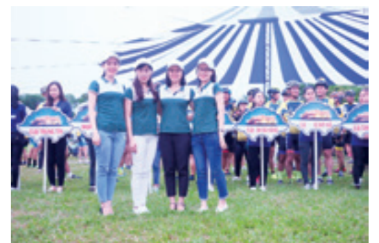
Đại diện Vietcombank Huế chụp ảnh lưu niệm tại lễ khai mạc