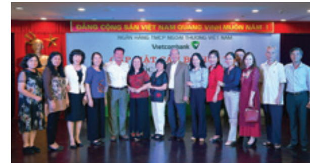
Các cán bộ hưu trí chụp ảnh kỷ niệm tại TP. Hà Nội

tục đưa Vietcombank phát triển mạnh mẽ, bứt phá, mang lại niềm tự hào, phấn khởi cho tất cả những người đã và đang công tác dưới mái nhà chung Vietcombank.