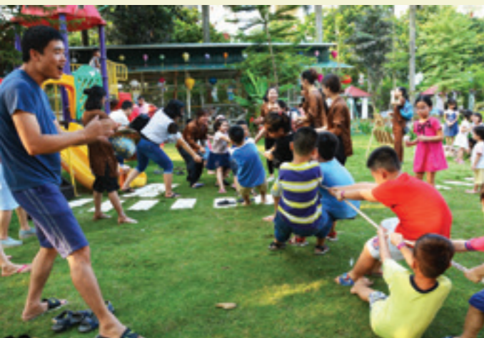
Một trận kéo co rất sôi động của các cháu thiếu nhi

Chiều ngày 22/9/2018, Công đoàn và Đoàn cơ sở Vietcombank Hải Dương phối hợp tổ chức thành công chương trình “Vui tết trung thu - Vietcombank Hải Dương” cho các cháu là con CBNV Chi nhánh. Chương trình đã thu hút được sự tham gia nhiệt tình và đông đảo của các cháu thiếu nhi và để lại ấn tượng tốt đẹp trong lòng người tham dự.