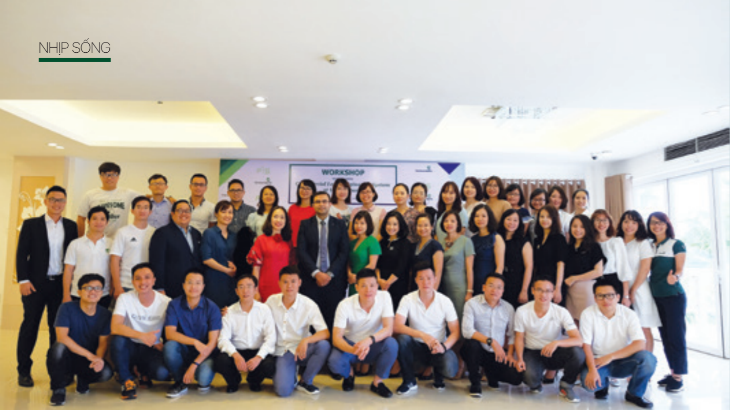
Tập thể Đội dự án CLOS tham gia tại buổi đào tạo