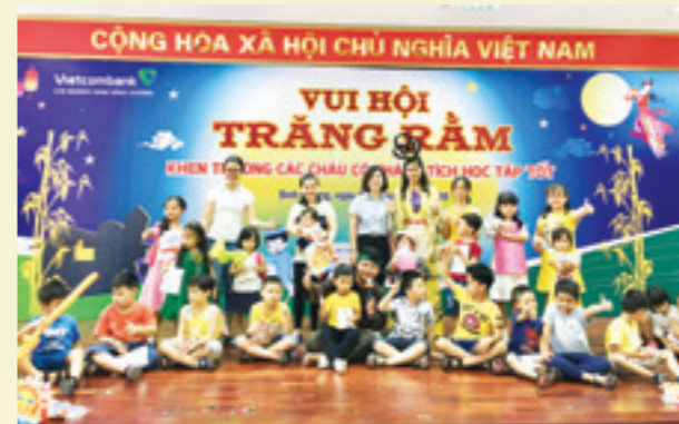
Không khí vui tươi của chương trình Vui hội Trăng rằm 2018 của chi nhánh Nam Bình Dương

Ngày 15/9/2018, Công đoàn phối hợp cùng Đoàn Thanh niên Vietcombank Nam Bình Dương đã tổ chức thành công chương trình Vui hội Trăng rằm 2018 nhằm tạo sân chơi cho các bé thiếu nhi là con của CBNV trong chi nhánh. Đây cũng là dịp để CBNV, người lao động có dịp gặp gỡ, trao đổi, chia sẻ kinh nghiệm nuôi dạy con cái.