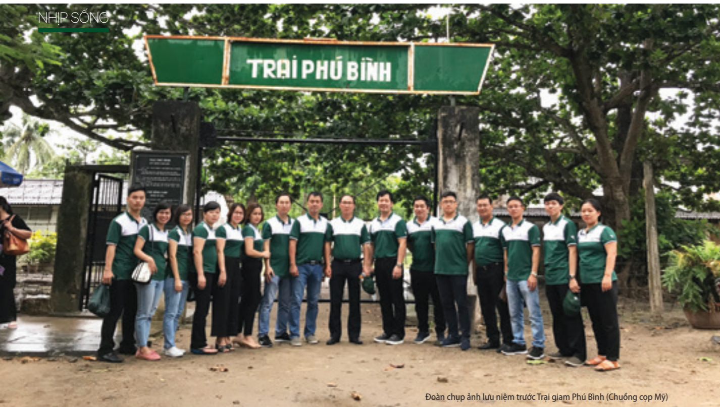
Đoàn chụp ảnh lưu niệm trước Trại giam Phú Bình (Chuồng cạp Mỹ)