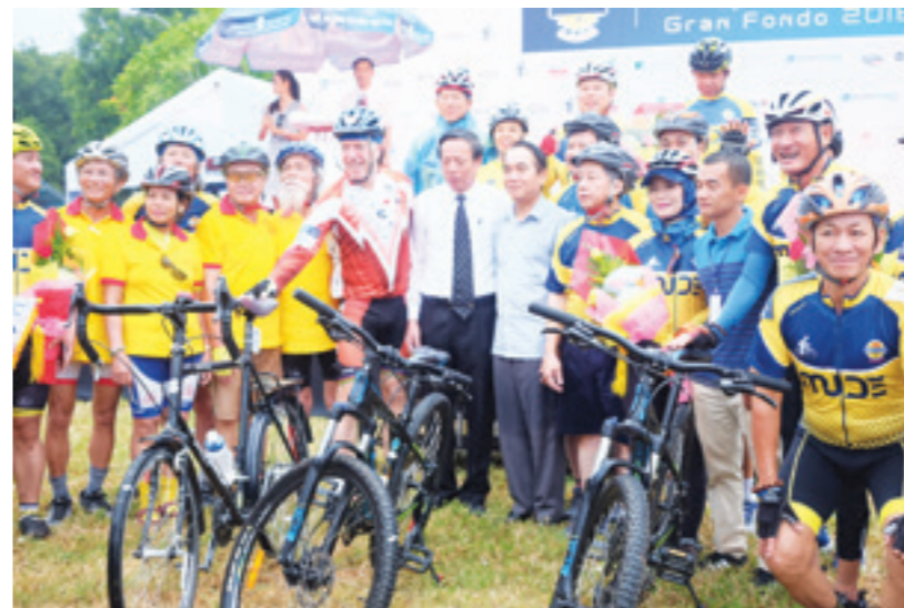
Lãnh đạo tỉnh Thừa Thiên Huế chụp ảnh lưu niệm cùng các vận động viên