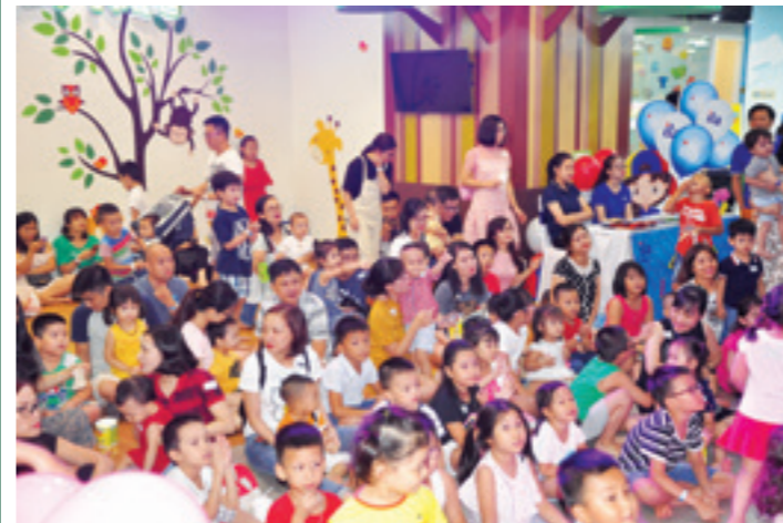
Vui chơi cùng các cháu thiếu nhi

Chương trình hội thảo được chuẩn bị tốt về nội dung, hình ảnh minh họa, dẫn chứng cụ thể, lồng ghép tình huống thực tế và được trình bày sinh động. Nhằm động viên khuyến khích các nhóm nghiệp vụ tham gia thuyết trình trong Hội thảo, Ban tổ chức đã trao thưởng động viên cho các nhóm gồm: 01 giải Nhất, 01 giải Nhì và 2 giải Ba cho các phòng: Khách hàng, Dịch vụ Khách hàng, Kế toán và Hành chính Nhân sự - Ngân quỹ.