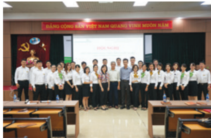
Các Đảng viên tham dự hội nghị