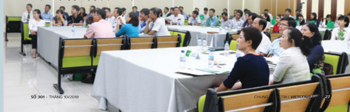
Các đại biểu chú ý lắng nghe các gói giải pháp tài chính từ phía Vietcombank

Theo thống kê tháng 8/2018 của UBND thị xã Bến Cát, hiện nay trên địa bàn thị xã có 08 Khu công nghiệp với tổng số DN trên địa bàn là 3.249 DN, trong đó số lượng DNVVN chiếm tới 62% (khoảng 2.000 DN). Gần ½ số DNVVN đã mở tài khoản và giao dịch tại chi nhánh Bắc Bình Dương, trong đó, gần 100 khách hàng vay vốn với dư nợ hơn 260 tỷ đồng.