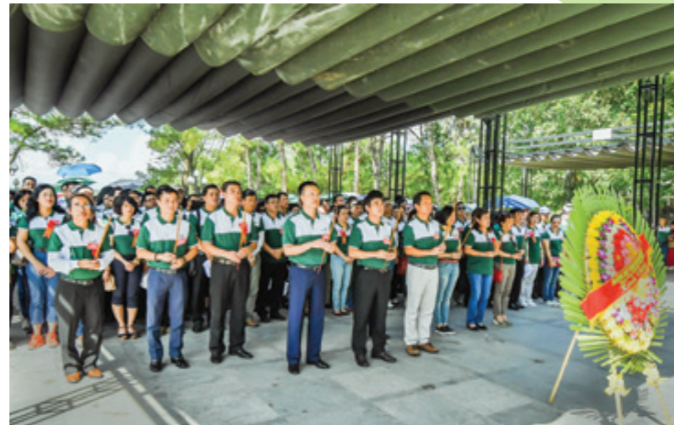
Đoàn đại biểu Đảng bộ TSC Vietcombank dâng hương tưởng niệm các anh hùng liệt sỹ tại Nghĩa trang Liệt sỹ Quốc gia Trường Sơn

Tại nơi linh thiêng này, các đoàn viên đã cất cao lời ca, tiếng hát tôn vinh công lao to lớn của các chiến sỹ bộ đội Trường Sơn, những anh hùng liệt sỹ đã cống hiến, hy sinh cho sự nghiệp giải phóng dân tộc, thống nhất đất nước.