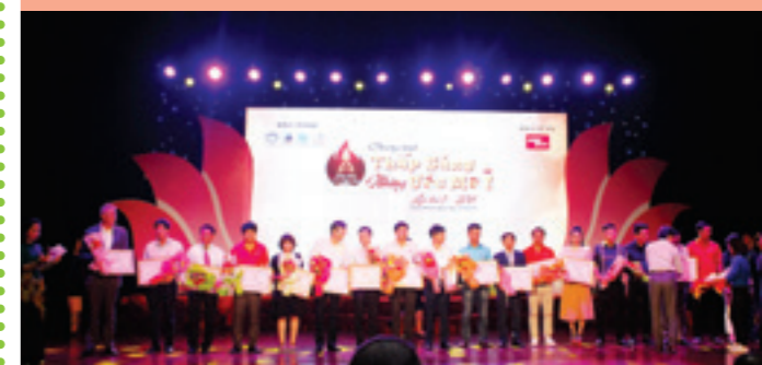
300 suất quà và học bổng được trao tặng cho các em thiếu nhi

Đồng hành cùng chương trình “Thắp sáng những ước mơ”, Vietcombank thêm một lần khẳng định mục tiêu xuyên suốt là hướng tới một Ngân hàng Xanh, phát triển bền vững vì cộng đồng, vì một tương lai tốt đẹp hơn cho trẻ em Việt Nam.