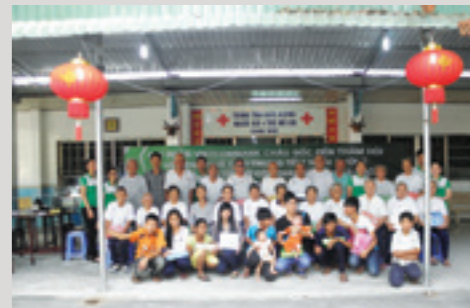
Vietcombank Châu Đốc thăm hỏi trao quà cho Trung tâm Nuôi dưỡng người già và trẻ mồ côi Châu Đốc

Song song nhiệm vụ hoạt động kinh doanh, phát huy bản sắc văn hóa Vietcombank, Chi nhánh luôn quan tâm đến công tác ASXH của