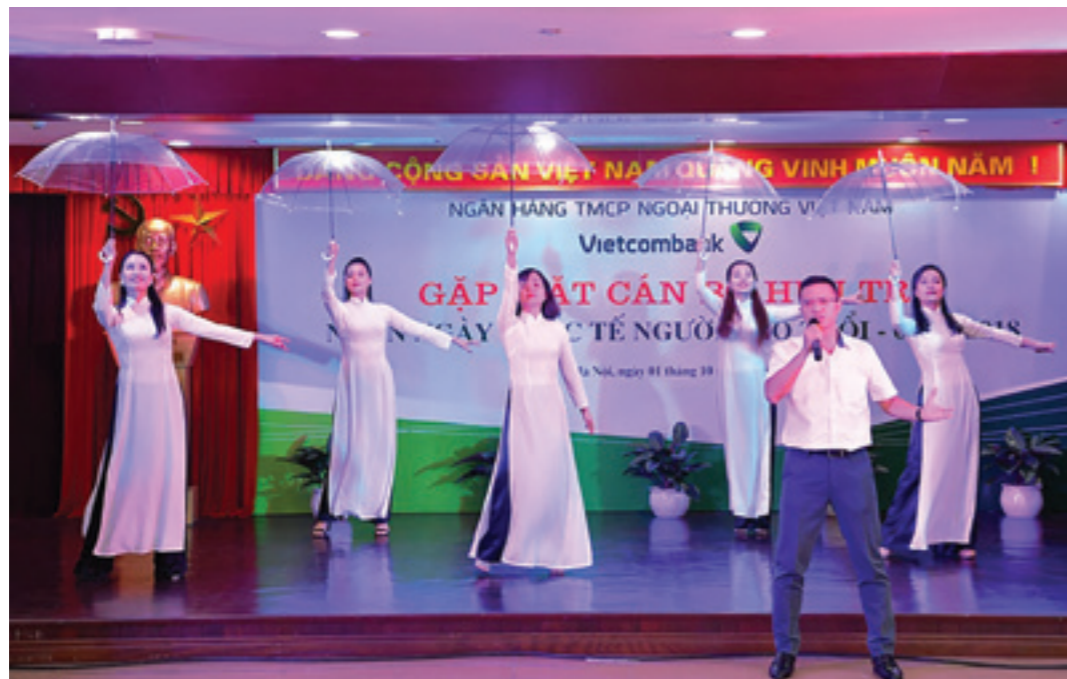
Tiết mục văn nghệ của cán bộ Vietcombank chào mừng ngày Quốc tế Người cao tuổi