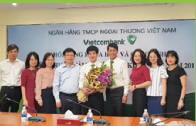
Hội đồng nghiệm thu và nhóm nghiên cứu đề tài

Đề tài đã được Hội đồng nghiệm thu nhất trí thông qua, nhận xét tốt và chấm loại Giỏi.