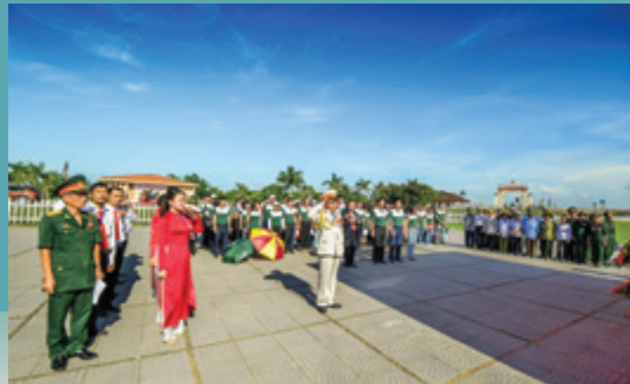
Đoàn đại biểu Đảng bộ TSC Vietcombank thực hiện nghi thức chào cờ Tổ quốc tại Khu di tích Quốc gia đặc biệt đồi bở Hiến Lương – Bến Hải

TỪ NGÀY 21-23/09/2018, ĐẢNG BỘ TRỤ SỞ CHÍNH (TSC) VIETCOMBANK ĐÃ PHỐI HỢP VỚI TRUNG TÂM GIÁO DỤC TRUYỀN THỐNG LỊCH SỬ TỔ CHỨC CHƯƠNG TRÌNH VỀ NGUỒN TẠI TỈNH QUẢNG BÌNH, QUẢNG TRỊ CHO TOÀN THỂ ĐẢNG VIÊN TẠI TSC VIETCOMBANK. ĐÂY LÀ ĐỢT SINH HOẠT CHÍNH TRỊ CÓ SỐ LƯỢNG ĐẢNG VIÊN THAM GIA LỚN NHẤT CỦA ĐẢNG BỘ TSC CHO TỚI NAY VỚI GẦN 600 NGƯỜI.