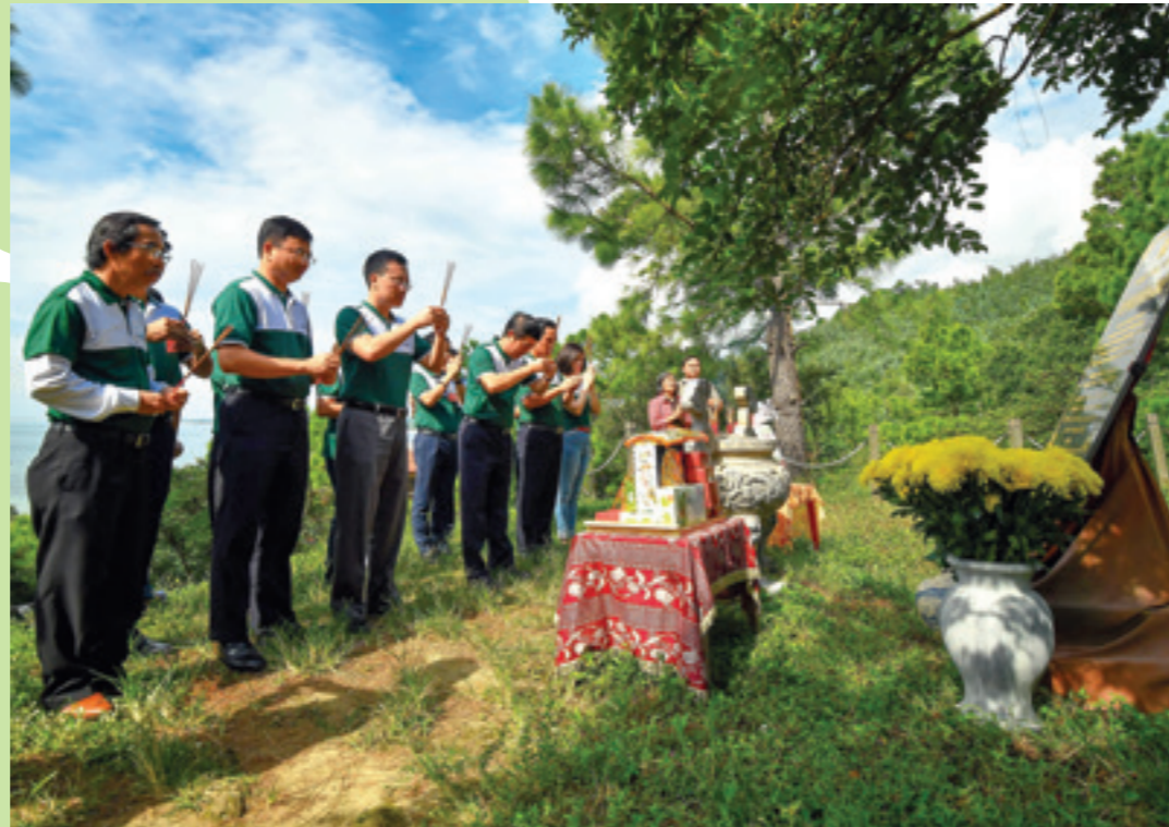
Đoàn đại biểu Đảng bộ TSC Vietcombank dâng hương viếng Đại tướng Võ Nguyên Giáp

Buổi chiều cùng ngày, Đoàn đại biểu Đảng bộ TSC Vietcombank đã thực hiện nghi thức chào cờ Tổ quốc tại Khu di tích Quốc gia đặc biệt đồi bờ Hiền Lương - Bến Hải, một địa danh lịch sử mà trong cuộc đấu tranh thần thánh chống Mỹ cứu nước đã trở thành biểu tượng của nỗi đau chia cắt và rạn nứt chủ nghĩa anh hùng cách mạng, khát vọng thống nhất đất nước của dân tộc Việt Nam. Tại đây, đoàn đã được nghe giới thiệu về từng địa điểm lịch sử trong cụm di tích như: cầu Hiền Lương, cột cờ, giàn loa phóng thanh, nhà liên hợp, đồn bốt, hầm hào, đường giao thông... và các địa điểm