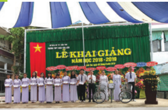
Ông Võ Thành Thống (thứ tư từ phải qua) – Ông Võ Thành Thống – Phó Bí thư Thành ủy, Chủ tịch UBND TP. Cần Thơ - trao học bổng và xe đạp do Vietcombank Cần Thơ tài trợ cho học sinh có hoàn cảnh khó khăn của trường THPT Châu Văn Liêm.

Sáng ngày 05/09/2018, nhân dịp lễ khai giảng năm học mới 2018 – 2019, Vietcombank Cần Thơ phối hợp với Sở GD & ĐT thành phố Cần Thơ và Báo Cần Thơ thực hiện chương trình Tiếp sức đến trường, trao tặng 70 suất học bổng, 53 xe đạp, 3 tranh vẽ tường và 1.000 quyển tập cho học sinh nghèo