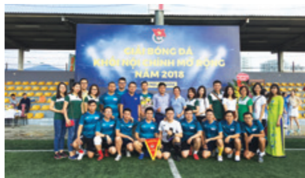
Đội bóng đá và đội cổ vũ của Đoàn Vietcombank

Kết thúc giải đấu, đội Tòa án Nhân dân tối cao đoạt giải Nhất, đội Văn phòng Quốc hội đoạt giải Nhì, đội Bộ Tư pháp đoạt giải Ba và đội Vietcombank đoạt giải Tư.